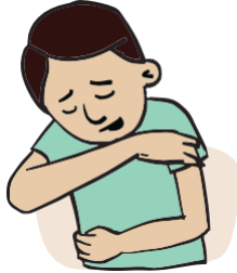
ክትስዕል ከሌላ አፍካ ብምናትካ ወይ ኩርናዕ ኢድካ ሸፍን