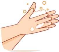
አእዳውካ ቀጸሊ ብማይን ሳምና ተሓጸብ