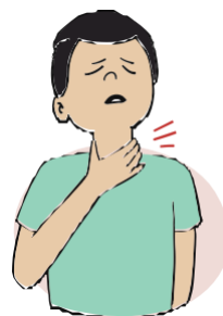
ቁስሊ/ ቃንዛ ጎሮሮ

በዚ ቫይረስ'ዚ ተለኪፈ ወይ ድማ ተቓሊዕ'የ ዝብል እምነት አንተልዩካ፡ ቅድሚኒ ናብ ሕክምና ምኻድካ ናብ ሰብ ሞያ ጥዕናኻ ደውል።