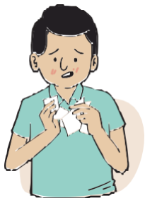
ጸረር ዝብል አፍንጫ