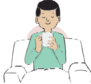
ሕማም እንተተሰሚዎካ ካብ ህዝባዊ ቦታታት ረሓቕ፡ ኣብ ቤት ኮፍ ባል